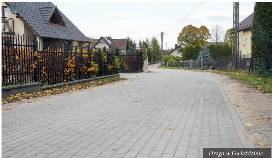
Droga w Gwieździnie

Fundusz sołecki to środki przysługujące każdemu sołectwu. Są one wydzielone w budżetach większości gmin w Polsce. Wysokość funduszu jest uzależniona od wielkości sołectwa. Rada Sołecka w porozumieniu z mieszkańcami może zdecydować na co wydać otrzymane pieniądze. Tak też stało się w przypadku Gwieździna i Międzyborza. - Miejscowość Gwieździn, tam zbudowano fragment drogi z kostki polbrukowej. Chodzi o odcinek w kierunku przepompowni ścieków i hydroforni. Jeżeli chodzi o miejscowość Międzybórz, to droga biegnąca w po-