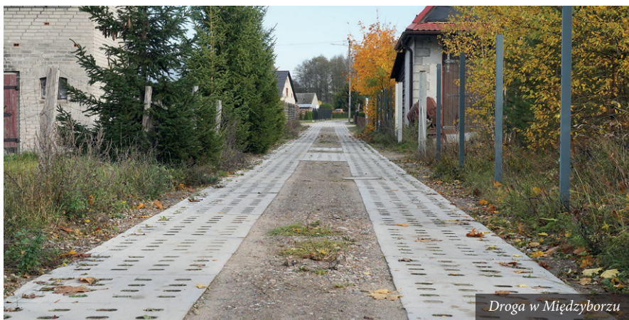
Droga w Międzybórze