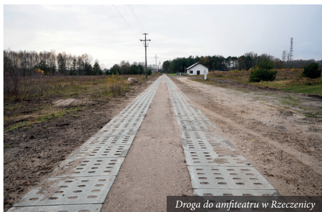
Droga do amfiteatru w Rzeczenicy