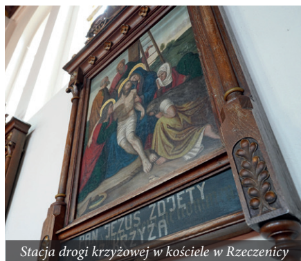
Stacja drogi krzyżowej w kościele w Rzeczenicy