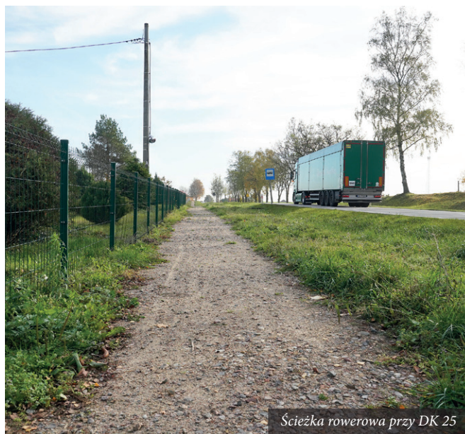
Ścieżka rowerowa przy DK 25

Wspólnie z nadleśnictwem Czarne Człuchowskie wykonano również żwirową ścieżkę rowerową. Jest to odcinek biegnący wzdłuż ulicy Białobórskiej od stacji benzynowej do leśniczówki.