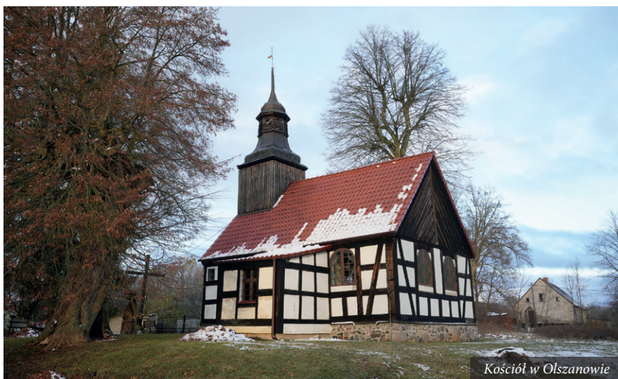
Kościół w Olszanowie

Warto podkreślić, że w przypadku tego programu wysokość dofinansowania stanowi aż 98 procent wartości inwestycji. Gmina Rzeczenica dołoży z własnego budżetu zaledwie 2 procent, czyli około 28 tysięcy złotych.