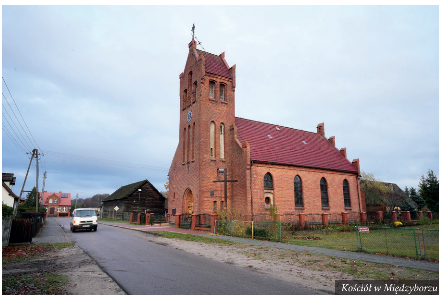
Kościół w Międzyborzu