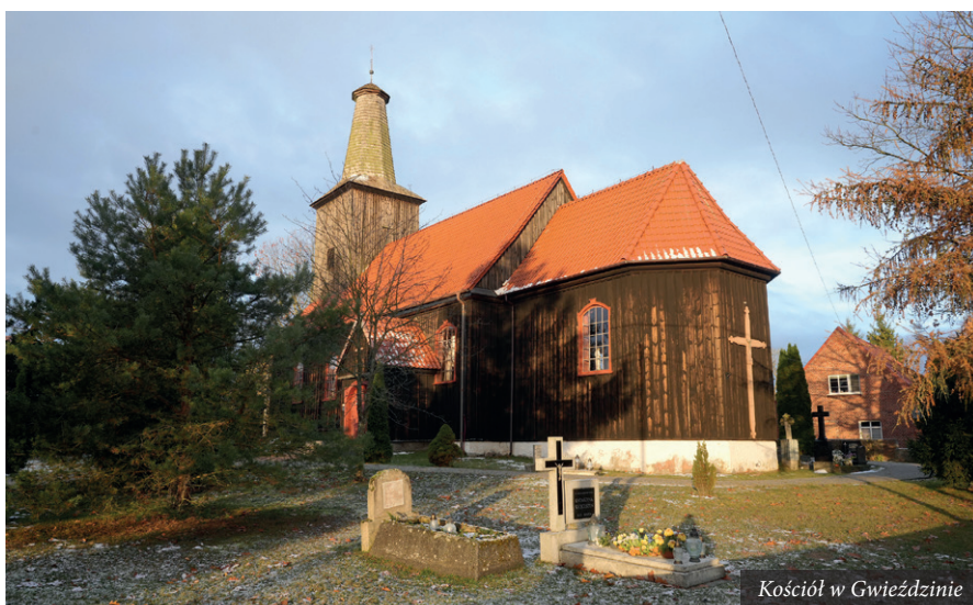
Kościół w Gwieździnie