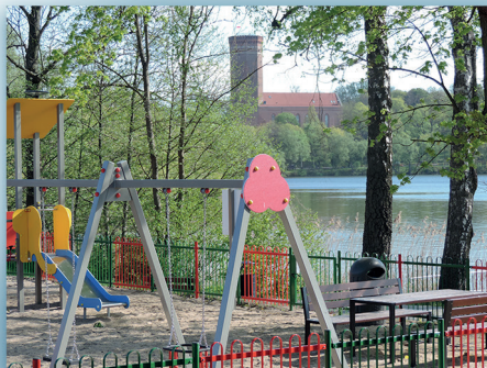
Plac zabaw i promenada

Mowa tu o projekcie pod nazwą „Utworzenie transportowych węzłów integrujących wraz ze ścieżkami pieszo-rowerowymi i rozwojem sieci publicznego transportu zbiorowego na terenie Chojnicko-Człuchowskiego Miejskiego Obszaru Funkcjonalnego” , w ramach którego uzupełnione zostały brakujące fragmenty drogi gminnej - odcinek łączący ul. Zamkową poprzez ul. Garbarską, Jacka i Agatki, Łąkową z ul. Szczecińską. Wybudowano także nowe ścieżki pieszo-rowerowe umożliwiające dotarcie do dworca kolejowego. Drugi projekt to „Rewitalizacja Śródmieścia w Człuchowie” , dzięki któremu zagospodarowano całą przestrzeń promenady. Powstał taras widokowy, drewniane altanki, siłownia plenerowa i plac zabaw. Część drogowa dotyczyła wymiany nawierzchni drogi dojazdowej, budowę kanalizacji deszczowej i oświetlenia.