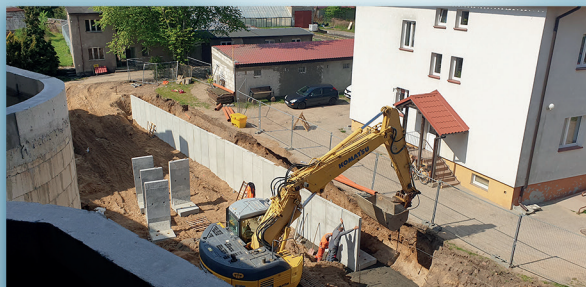
aleja Wojska Polskiego i ul. Jeziorna

Modernizowany jest obecnie dojazd do posesji położonych w pobliżu skrzyżowania alei Wojska Polskiego z ulicą Jeziorną . W pierwszej kolejności zbudowana zostanie tam kanalizacja deszczowa. Sięgacz, droga wewnętrzna o długości ok. 150 metrów i szerokości 5 metrów, zostanie utwardzony kostką betonową. Na końcu, dzięki poszerzeniu do 8 m, powstanie miejsce do zawracania. Planowana jest budowa chodnika oraz 5 miejsc parkingowych. Całe zadanie ma kosztować 365 tysięcy złotych. Miasto zapłaci połowę tej kwoty. Drugą połowę zgodził się sfinansować prywatny przedsiębiorca.