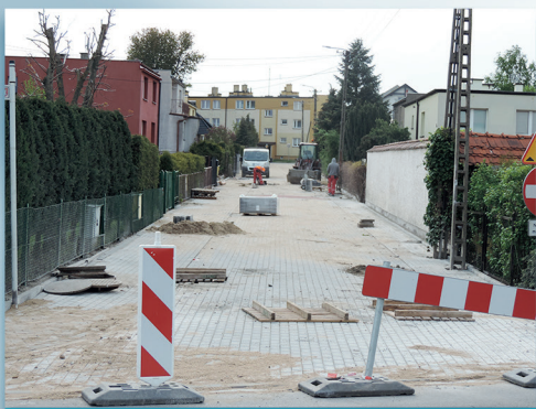
ul. Mieszka I

Ponad 190 tysięcy złotych będzie kosztował remont ulicy Mieszka I . Jest to kontynuacja większego frontu robót, w ramach którego w ubiegłym roku zmodernizowano m.in. ul. Chrobrego. Zadanie obejmuje przebudowę nawierzchni drogowych o łącznej długości ok. 150 metrów bieżących. Wykonany tam zostanie nowy ciąg pieszo – jezdny o szerokości 7 metrów. Będą też dwa progi zwalniające. Zadanie jest finansowane w całości z budżetu miasta.