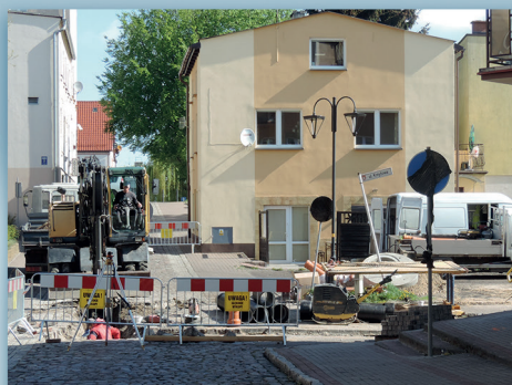
ul. Żółkiewskiego, Krzyżowa i Rynek