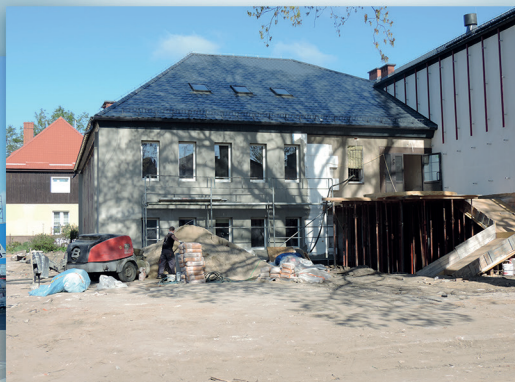
Miejski Dom Kultury